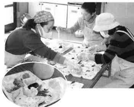
平成28年度も多くの町会で在宅福祉員が、配食・会食会・茶話会を実施しました。

3月3日、金室町で配食を実施しました。4人の在宅福祉員が朝早くから、弁当を手作り。「笑顔になってもらえることが嬉しい」と見た目も味もこだわりのお弁当が15個完成しました。お昼に合わせて一人暮らし高齢者宅を訪問し手渡ししました。