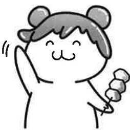
秩父市イメージキャラクター ポテくん