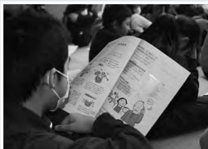
(テキストを使った学習)

当日は、認知症がどんな病気かということを学んだ後、子ども役やお母さん役などを児童が演じるロールプレイングを交えて認知症の人にどんな支援が必要か学びました。