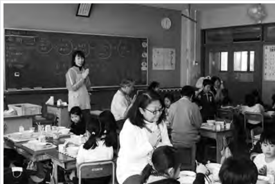
(みんなでいただきます！)

先生役の高齢者から児童へ「上手に遊べて素晴らしかった」「一緒に遊べて楽しかった」と講評がありました。