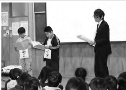
(ロールプレイング体験中)