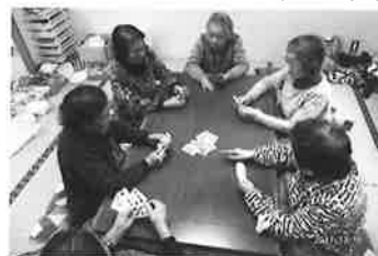
高齢者生きがいと居場所作り事業

利用者延人数 235人 稼働日数 161日 あいサポート運動推進事業 研修参加者 158人参加 認知症サポーター養成事業 研修開催数 21回 参加者数 704人 秩父市生活支援体制整備事業 秩父市高齢者生きがいと居場所づくり事業 (大滝地区) (新規) 開催日数227日 年間延利用者数 2,043人