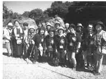
家族介護者お楽しみ交流会