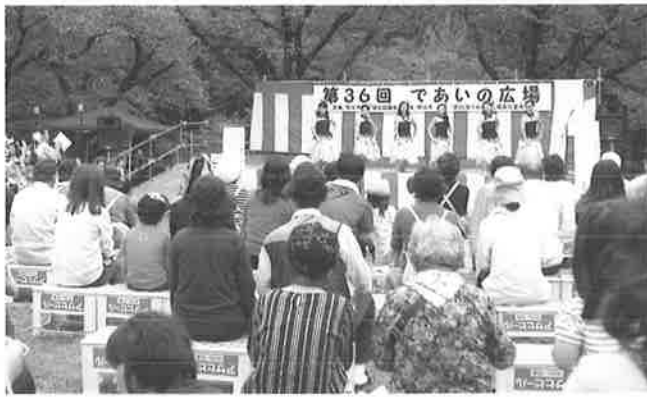
過去のであいの広場開催写真