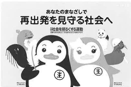
7月は「社会を明るくする運動」強調月間・再犯防止啓発月間です。