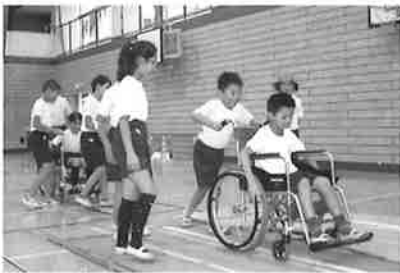
福祉協力校への体験学習指導