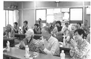
介護予防普及啓発事業 (縁側カフェ)

介護予防普及啓発事業 (縁側カフェ) (荒川地区) (新規) 開催日数63日 延参加者 1,301人 延協力者 717人