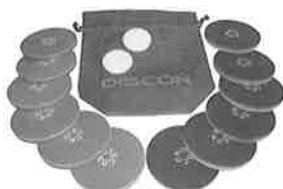
ディスコンセット(ディスク12枚、ボール2枚、収納袋)

投げ方によってディスクが重なったり、ポイントやディスクを跳ね飛ばしたり、思わぬ展開にハラハラドキドキ。子どもから大人まで楽しめます。