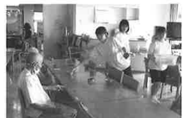
福祉施設でのボランティア (お茶配り)