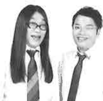
天狗 (埼玉県住みます芸人)