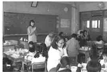
高齢者と児童と一緒に給食を 食べ交流を図りました。