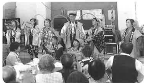
登録していただいた皆さんによるパフォーマンスの様子です。

地域のイベントや施設などでパフォーマンスを披露していただけるボランティアを引き続き募集しています。