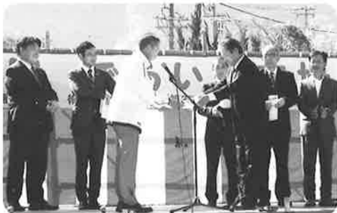
感謝状を久喜会長から贈呈

秩父中央ライオンズクラブ結成40周年記念事業の一環として、テント2基を寄贈していただきました。