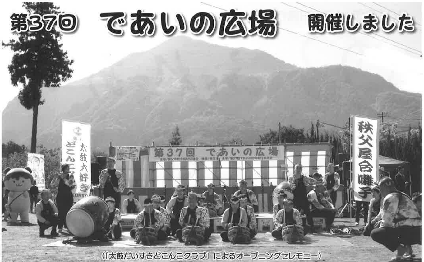
(「太鼓だいすきどこんこクラブ」によるオープニングセレモニー)

「ふくしのお祭り」として、多くの人を楽しめる交流の場を目指し、実行委員会で協議を重ねました。今回から車いすの移動もしやすい会場で開催となりました。