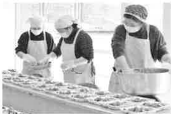
(在宅福祉員による配食の準備)