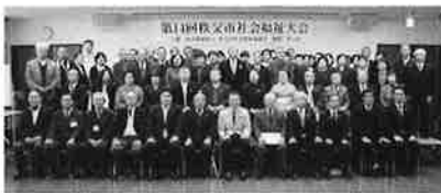
（受賞者のみなさん）