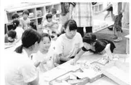
（学童での勉強指導）