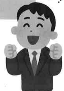
生活支援 コーディネーター

この日は講師を招いた折紙教室で、おしゃべりを楽しみつつ、素敵な作品が完成しました。