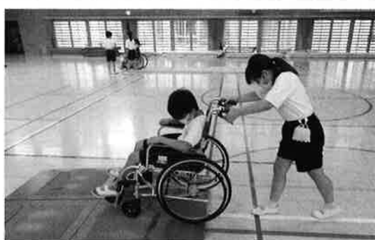
車椅子の「乗る・押す」を体験！