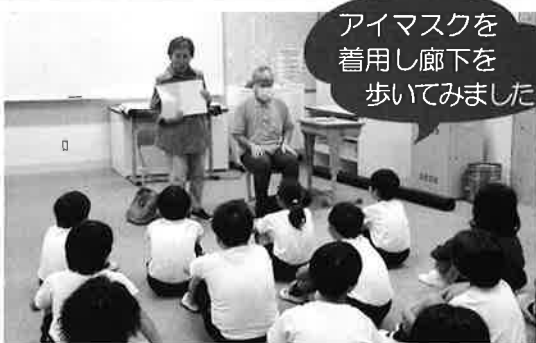
講師（視覚障がい者）の話を真剣に聞く様子