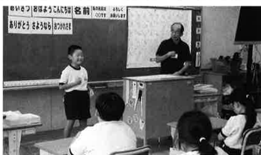
講師（聴覚障がい者）に挨拶や自己紹介、指文字を学ぶ様子