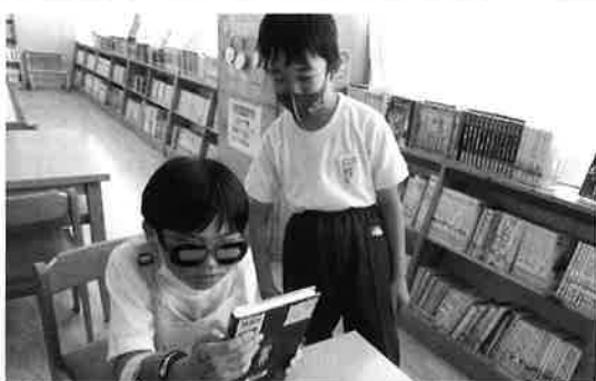
高齢者の身体の状態を体験！