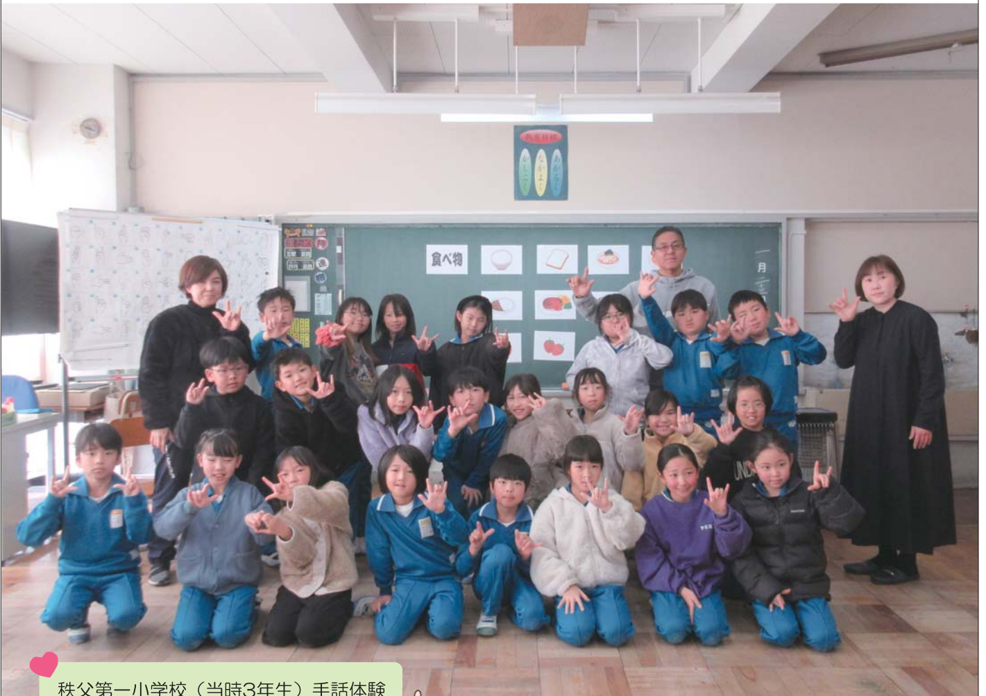
秩父第一小学校（当時3年生）手話体験 世界共通の“アイラブユー”